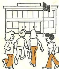
a la escuela